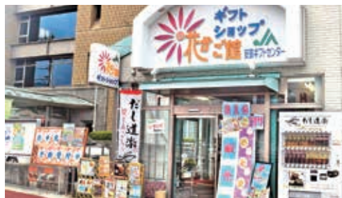
▲各種ギフト商品や管内加工品など豊富に取り揃えております。

問 ギフトセンター海田店 (082)822-1616 所在地/安芸郡海田町窪町8-8 営業時間/9:00~17:00 定休日/水曜日・日曜日